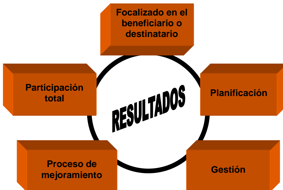
Figura 3 ESQUEMA DEL DIAGRAMA TQM

Entre las limitaciones del modelo TQM, de acuerdo con Schofield 35 , se puede señalar que cada vez es más evidente que las dificultades de implementar procesos orientados hacia al benchmarking en las universidades son similares a aquellas encontradas en la incorporación de otros enfoques comprensivos para la gestión de calidad, como acontece con el Modelo TQM. Tanto en Canadá como en algunos países europeos la implementación del Modelo TQM como de otros enfoques integrales han debido enfrentar aspectos propios de cada cultura, como así también limitaciones de carácter legal que tornan más difícil la implementación de modelos de gestión de calidad comprensivos 36 . No obstante ello, existe según Schofield evidencia dispar acerca de la real efectividad de modelos de gestión de calidad como el TQM u otros modelos en los sistemas de educación superior. Así por ejemplo, mientras autores como Doherty 37 dan cuenta del éxito de ciertas experiencias, otros enfatizan que el Modelo TQM escasamente ha contribuido a maximizar el potencial de las instituciones universitarias donde ha sido implementado 38 .